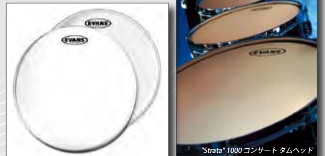
G2 クリアヘッド G2 コーテッドヘッド

カーフスキン色のコーティングが施された10 milのコンサート用タムヘッドです。暗めで丸みを帯びた基音を伴った暖かみのある音色、豊かな倍音とハッキリとした音程感が特徴です。