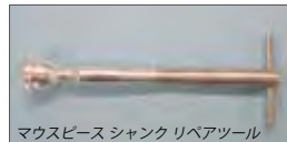
マウスピースシャンクリペアツール