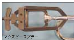
マウスピースブラー

A18-MC100 ハンディ チューバレスト ¥17,900+税 MC100CP ハンディポーチ ¥4,900+税