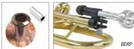
マウスピースアダプター