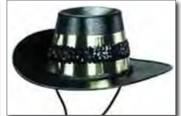
キャバリアー 参考価格 ¥9,200 + 税