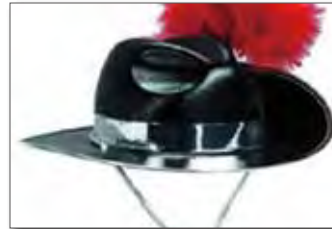
オージー (ハットバンド: マイラー 2.5cm 仕様) 参考価格 ¥7,700 + 税 ※羽根は別料金です。