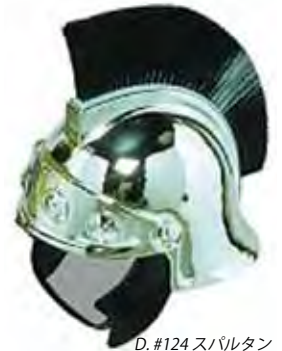
D. #124 スバルタン

※これらの写真の他にも色や細かな仕様の変更も可能です。お見積もり致しますので詳しくはお問い合わせください。