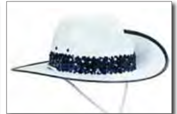
オージー (ハットバンド: スパンコール仕様) 参考価格 ¥8,400 + 税