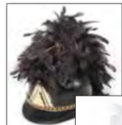
フレンチファントムブルーム