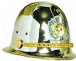
A. #117 レジメンタルガード

スタイルは全部で5種類。丈夫な段ボール製ケース付き。サイズはフリーサイズ、内側サイズ調整バンド付き。