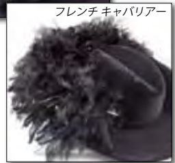
フレンチキャバリアー