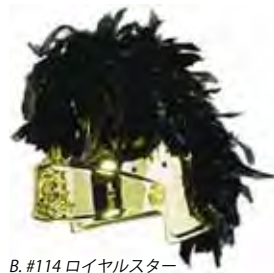
B. #114 ロイヤルスター