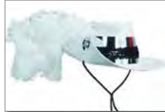
キャバリアー 参考価格 ¥9,200 + 税 ※羽根は別料金です。