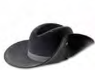
キャバリアー大型