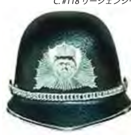
C. #118 リージェンシー