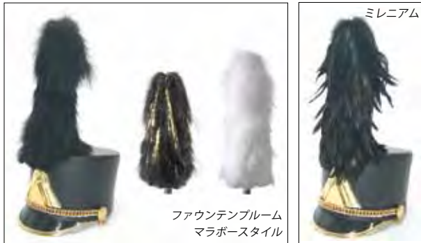
ファウンテンブルーム マラボースタイル