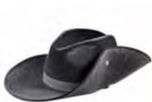
バンガード (オージー大型)

インチ換算誤差や加工誤差、材質特性などによりサイズに違いがある場合は、現物のサイズを優先させていただきます。