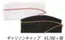
ギャリソンキャップ ¥3,700 + 税

サイドやバイザーの刺繍、フロントのチェーン、ブレイド、コードなど多様な飾りが可能です。お見積もりはお気軽に。 価格: ¥10,000 ~