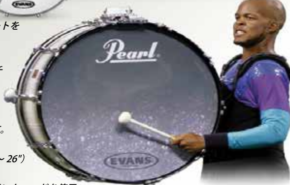
2012 DCI _ Blue Devils