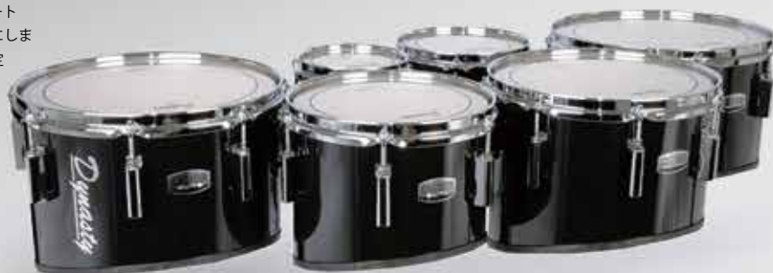
※写真はフルサイズ "83-DMST-3" セクセット

6 プライハードロックメイプルシェルを採用したダイナスティ カスタム エリート テナードラムは、ピアノでもフォルテでもより深みあるサウンドと音抜けを可能にしました。各タムの間はプレイヤーに最適な位置に固定され演奏の際のバランスも安定しています。またキャリアの SEM システムや J パーを受けるチルト部は前後に調整が可能ですので、楽器と体の距離を自在に調節することができます。また 2014 年、ハードウェアの標準仕様がシルバーメタリックになりました。 ヘッドは標準で「Remo/Dynasty Pinstripe Clear Head」を装備していますが、追加料金（楽器購入時は特別価格を適用します）でエバンスへの変更も可能です。