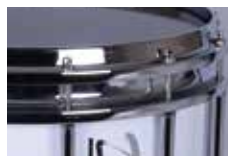
ハードウェア標準色: クロームプレート