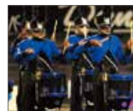
パウダーコーテッド: ダークブルー仕様