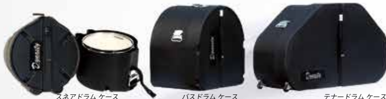
スネアドラム ケース