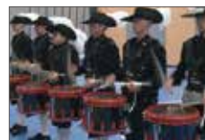
パウダーコーテッド: レッド仕様