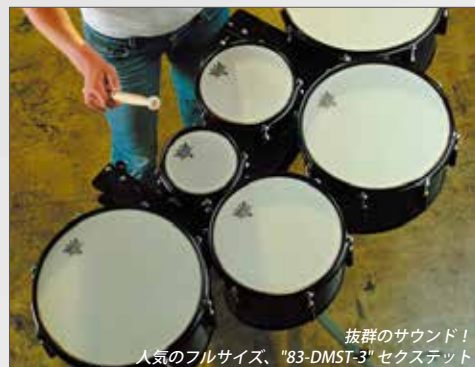
抜群のサウンド！人気のフルサイズ、"83-DMST-3" セクセット