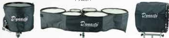
スネアドラム ケース