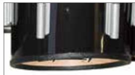
マルチテナードラム用エッジガード