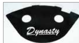
サウンドリフレクター