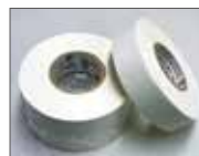
スティックテープ