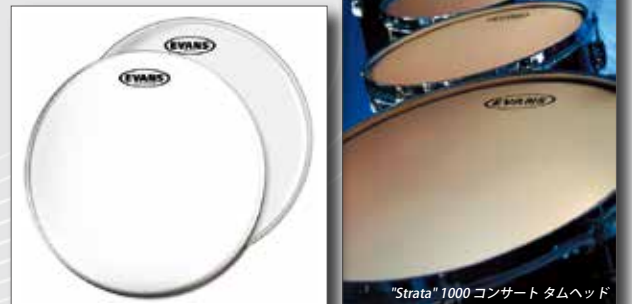
G2 クリアーヘッド G2 コーテッドヘッド

カーフスキン色のコーティングが施された10 milのコンサート用タムヘッドです。暗めで丸みを帯びた基音を伴った温かみのある音色、豊かな倍音とハッキリとした音程感が特徴です。